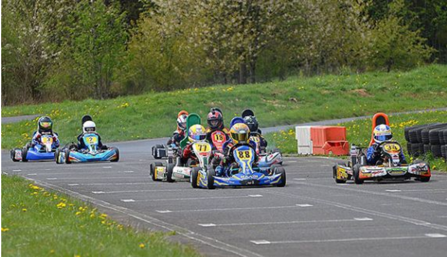
Einführungsrunde der Bambini-Klasse