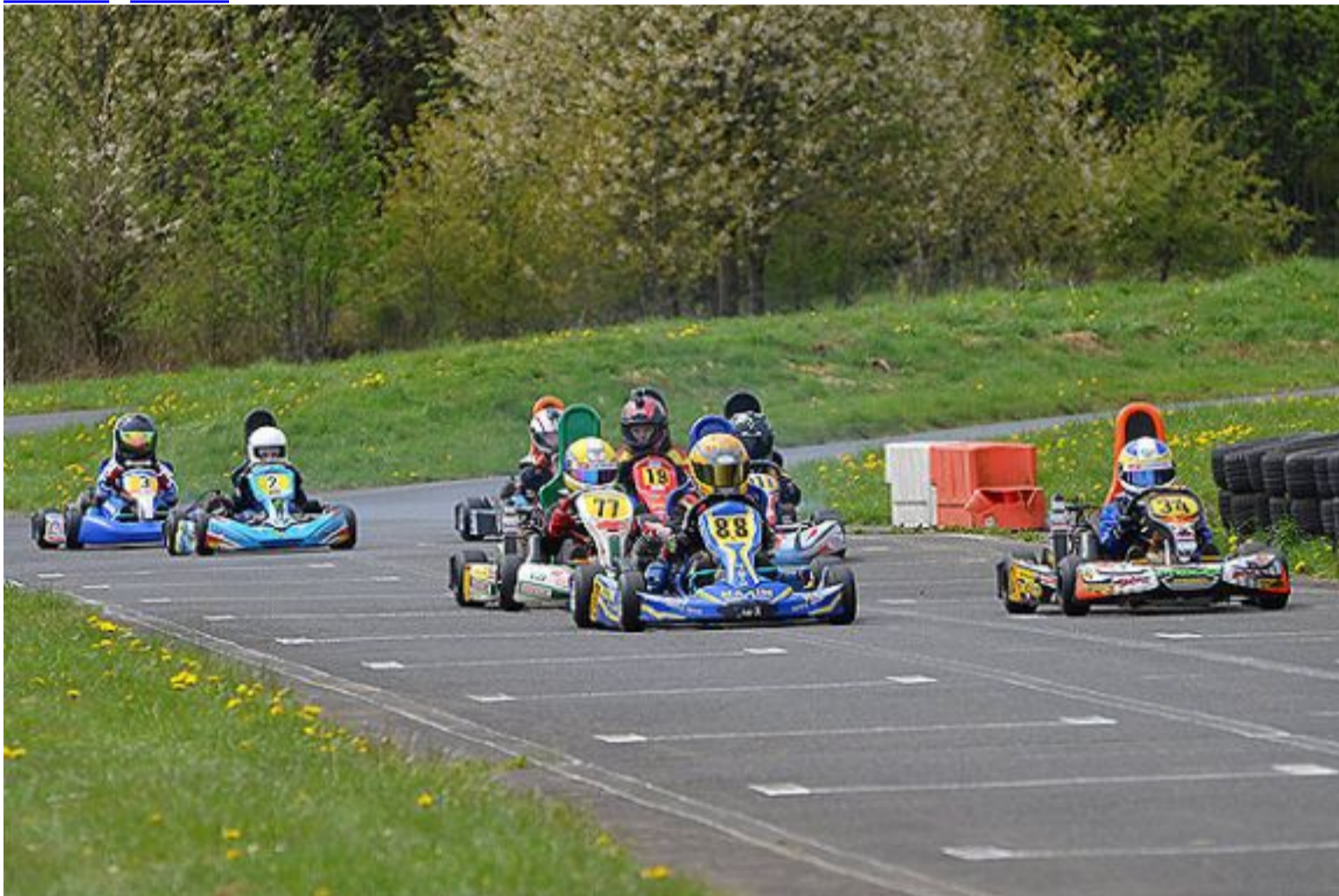
Einführungsrunde der Bambini-Klasse - Foto: KCBB

Die fast 40 Starter erlebten beim 1. Clublauf 2015 des KCBB auf der Dahlemer Binz in der Eifel am 2. Mai 2015 packende Zweikämpfe und einen erfolgreichen Start in die Saison 2015. Neben den Fahrern des KCBB und der befreundeten Clubs vom RSC Westerwaldring und vom KSC Obere Sieg starteten in allen fünf Klassen auch Gastfahrer aus dem Rheinland, dem Ruhrgebiet und dem Rhein Main Gebiet.